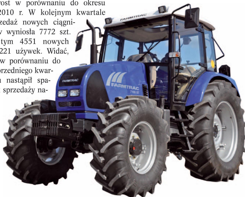
Moc nominalna motoru to 98 KM dla modelu 7100 DT oraz 110 KM dla modelu 7110 DT. Silnik to 4 cylindrowa konstrukcja Perkinsa wyposażona w turbinę.

W konstrukcji ciągnika Farmtracz serii 7000 zastosowano sprawdzone rozwiązania konstrukcyjne. Silnik to świetnie znana 4-cylindrowa konstrukcja Perkinsa wyposażona w turbinę. Moc nominalna motoru to 98 KM przy 2300 obr./min w przypadku modelu 7100 DT oraz 110 KM przy 2300 obr./min dla modelu 7110 DT. Maksymalny moment obrotowy to odpowiednio 384 i 416 Nm osiągane przy 1400 obr./min jednostki napędowej.